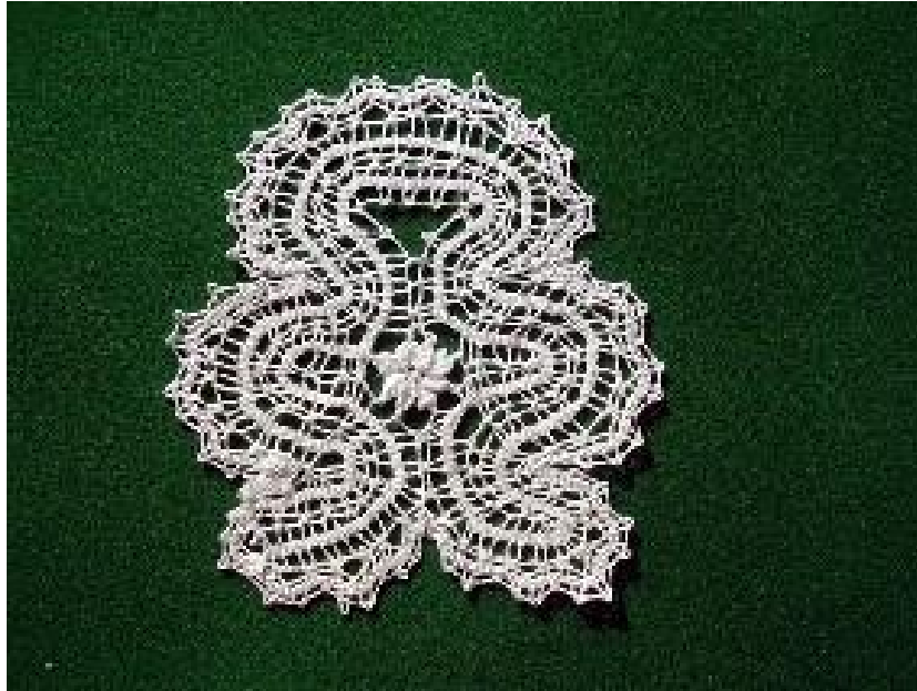
Slika 6: Ukrasna čipka , služi kao dekor za vitrinu. Veličine prosječno 30 cm, ne može se točno odrediti zato što je vijugava oblika. Oblik nedefiniran, neki dijelovi naročito vijuge podebljane su nekoliko puta, motivacija vaza pa bi se moglo reći da je čipkano u obliku vaze, a u središnjem djelu se dobro primjećuje motiv ruže, koji je podebljan. Etnografski primjerak također slikana iz arhive.