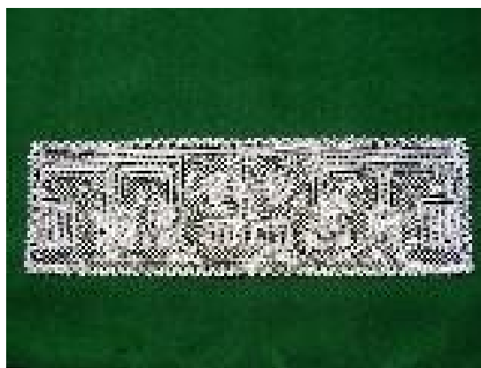
Slika 2: Čipka staza , izvorno slikana u arhivi.

U Međimurju je do preokreta došlo dok je gđa. Nada Marc prije sedam godina upitala na cesti Anu da li zna plesti špice te je tako započelo izvlačenje Svetomarske čipke iz zaborava, koja je odmah našla put u mnoge zemlje, gradove , ali i daleke kontinente.