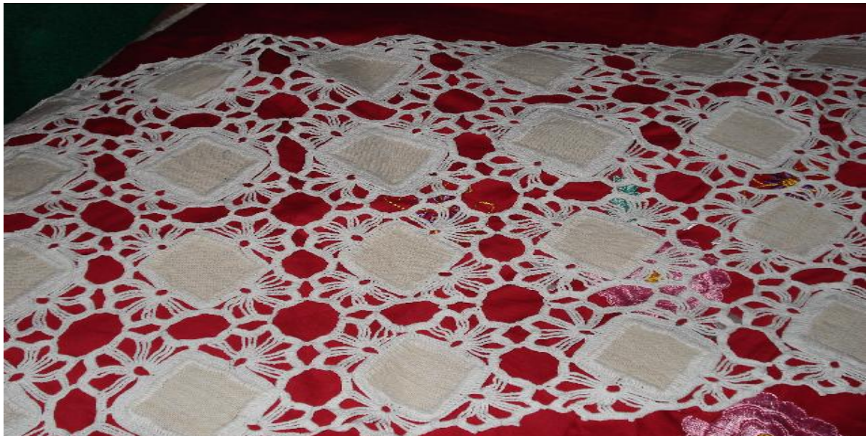
Slika 9: Čipkani pokrivač ,služi kao ukras , preko večeri bi se micao , a preko dana bi služio kao dekor za sobe .Nešto jednostavnije kombinacije. Kućni primjerak.