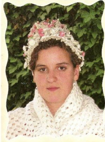
Slika 4: Čipkani šal, oko vrata dužine 1,5m te širine 35 cm, na glavi ukrasna čipka koja je služila kao veo u današnje vrijeme, no prije 20 godina prošlog stoljeća je veo zamjenjivala čipka, koja je ujedno i krasila frizure.

U prošlosti je bila izvor puke zarade, danas koristi u tradicionalne svrhe i gotovo svaka kuća ima barem jedan čipkani predmet.