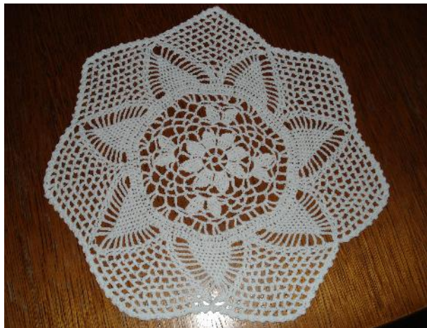
Slika 5: Međimurska čipka, stolni tabletić, služi kao dekor prostorije. Motiv cvijet, unikatna, Kućni primjerak