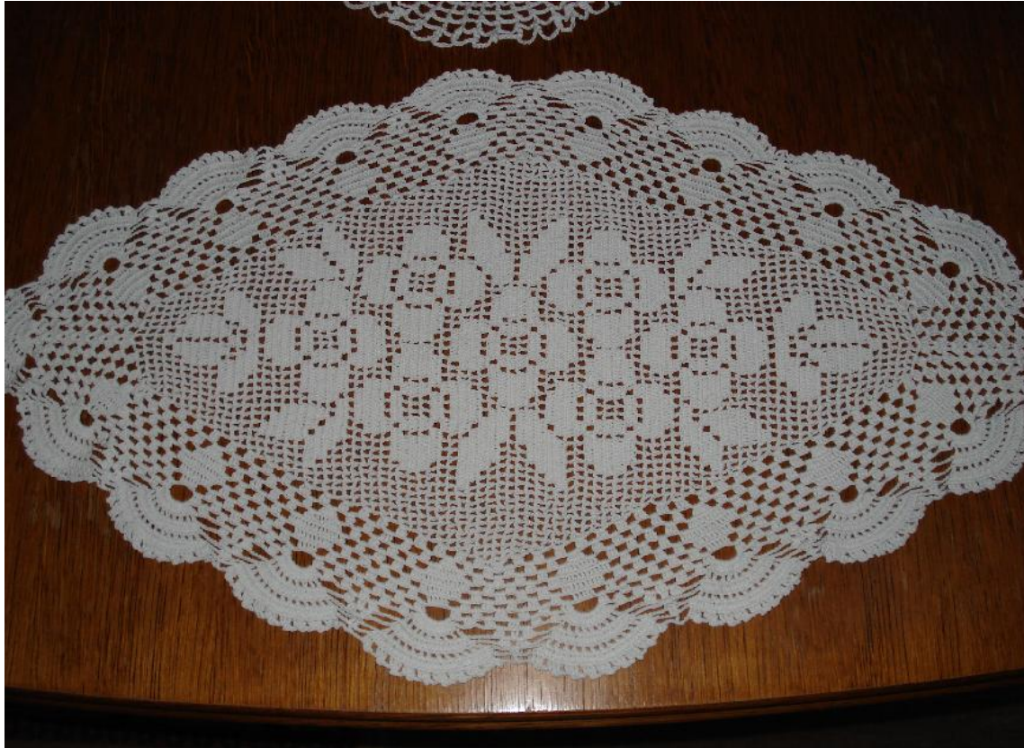
Slika 8: Čipkani tabletić. Veličine 50 cm od lijevog ruba do desnog , te 35 cm od donjeg ruba do gornjeg. Služi isto kao dekor , ukrašen cvjetnim motivima, rubova 5 cm na koje su iščipkani lepezni motivi , razmaka od jedne do druge lepeze 1 cm. Kućni suvenir.