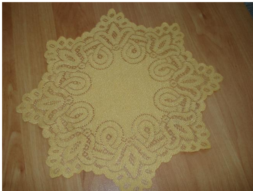
Slika 7: Čipkani tabletić, motiv nepoznat, nedefiniran predmet mašte. Veličine simetrično 35 cm. Rađena ručno od žutoga konca. Kućni primjerak slikan u domaćinstvu.